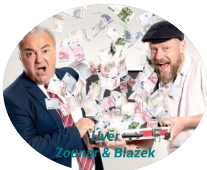
Úvěr Zounar & Blažek

Zájezd pouze pro abonenty koncertního předplatného 2022/2023 do Beskydského divadla v Novém Jičíně. • Odjezd autobusu z II. nádvoří zámku Žerotínů v 17:00.