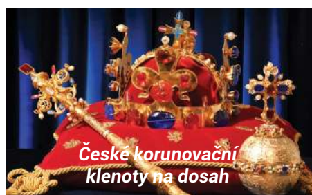
České korunovační klenoty na dosah

Dětské představení Michala Nesvadby. • Vstupné 290 Kč.