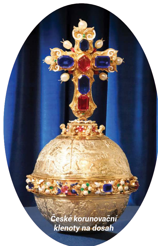
České korunovační klenoty na dosah