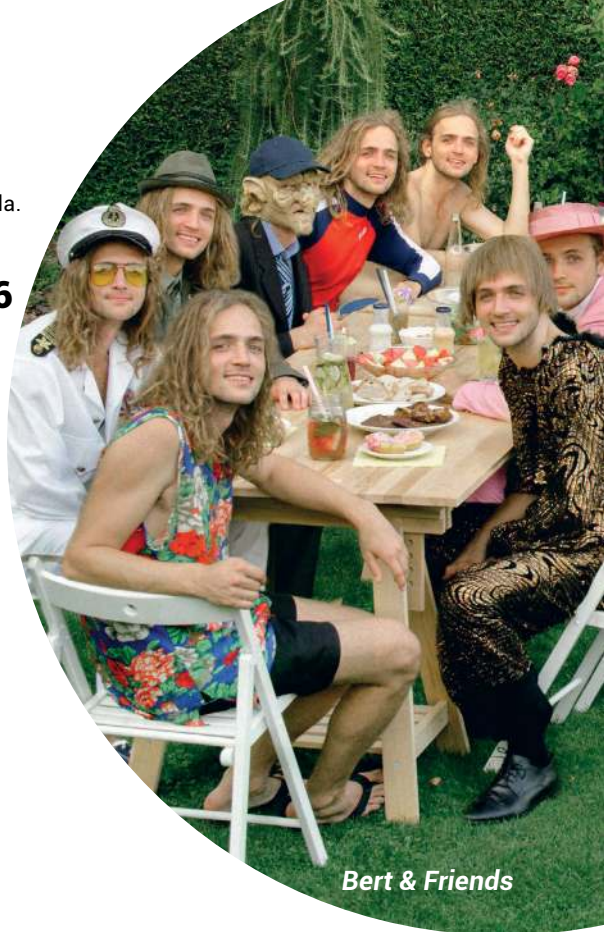
Bert & Friends