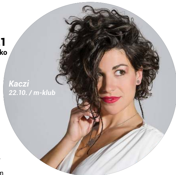
Kaczi 22.10. / m-klub

30 Štístko a Poupěnka Ať žijí pohádky! sobota • 15:00 • velký sál Štístko a Poupěnka se společně s broučky dostanou do pohádkového lesa... Zazní taneční hity Hejbní kostrou a Jájájá, ale nebudou chybět ani známé, osvědčené písničky. • Vstupenky na: https://www.ticketportal.cz/event/Stistko-a-Poupenka-At-ziji-pohadky • Poupěnka-Ať-žijí-pohadky • Vstupné 195 Kč.