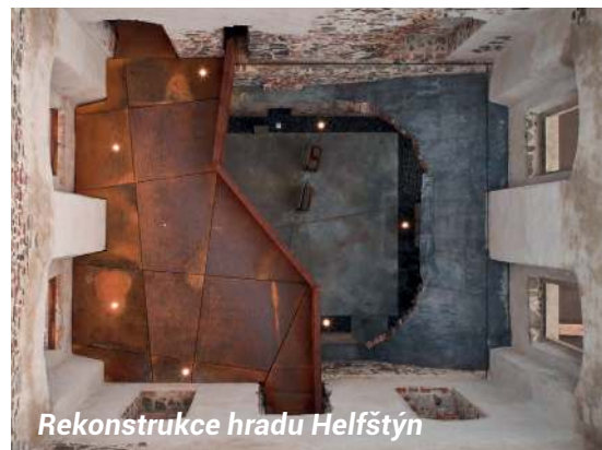
Rekonstrukce hradu Helfštýn

To nejlepší z české architektury. Šestý ročník soutěžní přehlídky nejlepších realizací postavených na území České republiky v období posledních pěti let. • Výstavu pořádá Česká komora architektů. • Vstupné 20 Kč.