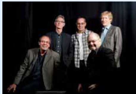
The Blues Band

The Blues Band u nás se svým kmenovým repertoárem vystoupí poprvé, ale Paul Jones a Tom McGuinness v bývalém Československu koncertovali už v říjnu 1965 s kapelou Manfred Mann. Byla to první špičková západní kapela, která u nás, tedy v Bratislavě, Uherském Hradišti a Praze, vystoupila. A taky myslím, že v Česku, už v nových časech, hrála kapela Manfreds, parta bývalých členů skupiny Manfred Mann, kde hrají i někteří muzikanti z Blues Bandu.