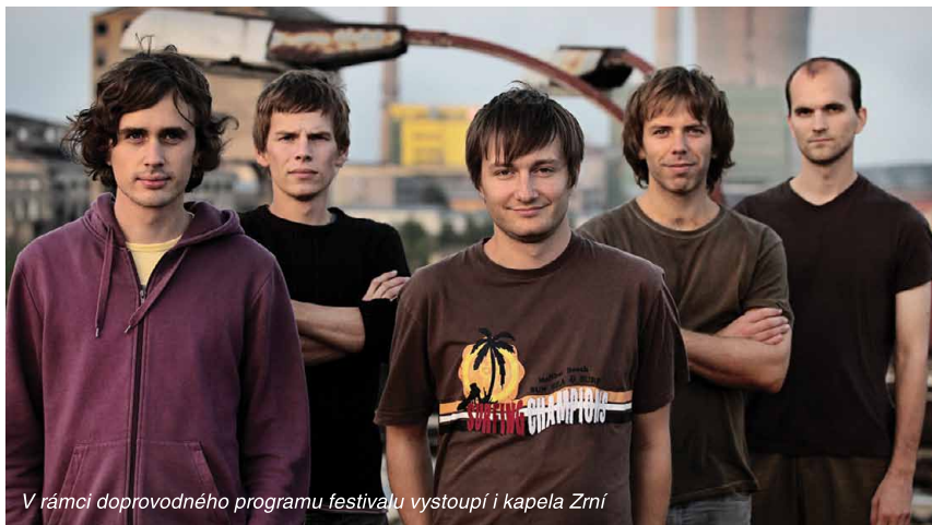
V rámci doprovodného programu festivalu vystoupí i kapela Zrní

Doporučení do celostátních soutěží nejsou jediné ceny, které odborná porota složená z dramaturgů, režisérů profesionálních divadel,